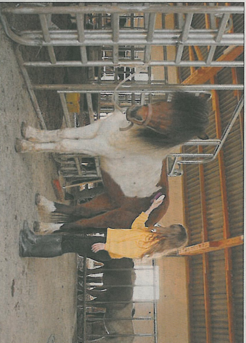
Dans l'écurie, plusieurs paddocks permettent aux chevaux d'aller et venir librement

Je travaille en relation avec un kiné qui m'envoie des enfants dont le handicap reste trop important pour pouvoir rejoindre un centre équestre classique où les leçons se déroulent de façon rigide et strictement formatée, mais qui sont par contre tout à fait capables d'intégrer un petit groupe dont l'objectif n'est ni la recherche de performances ni celle de la perfection. Un autre médecin m'envoie également beaucoup de jeunes qui