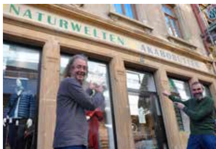
Doppelladen an der Place Wallis

Nach Einschätzung der New York Times sind die LOHAS genannten modernen Konsumenten („Lifestyle Of Health And Sustainability“) diejenige Konsumentengruppe, die weltweit am stärksten wächst. Zu ihren Überzeugungen gehört, möglichst keine unter fragwürdigen sozialen Bedingungen und schwerwiegenden ökologischen Folgen preiswert produzierten Textilien mehr zu kaufen. Aber das ist einfacher gedacht und entschieden als umgesetzt, fehlt es doch hierzulande an Geschäften, in denen Alternativen angeboten werden. In Luxemburg war Lucien Reger der Pionier, der mit seinem 1985 eröffneten Bio-Textilien-Geschäft „Naturwelten“ (ehedem „Pimpampel“) in Bonneweg bis vor wenigen Jahren konkurrenzlos war.