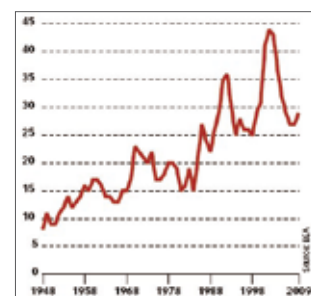
Part des profits du secteur financier dans l'ensemble des profits des entreprises domestiques américaines, en% (graphique tiré d'Alternatives économiques, juillet-août 2010)

A un troisième niveau, la finance organise à son profit un scandaleux détournement de fonds et de talents. Depuis le début des années 1980, les profits du secteur financier ne cessent de gonfler par rapport à ceux du reste de l'économie (voir graphique). Une telle rente ne peut qu'accroître les inégalités de revenus déjà criantes entre le secteur financier et le reste de l'économie.