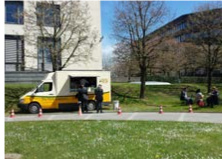
Sansa Food-Truck Myriam Barbara-Ziade

La ferme bio de la famille Scharll à Lellingen se concentre sur la production de lait de leurs 60 vaches laitières, mais produit également des céréales et des pommes de terre. Une spécificité est l'usage des possibilités de la digitalisation du déroulement, laissant beaucoup de libertés aux vaches.