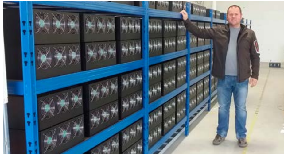
La ferme à bitcoin Genesis en Islande bénéficie d'une électricité bon marché pour son activité.

Une grande partie des applications fintech existantes (dont la crypto-monnaie bitcoin), utilisent le principe de la blockchain. Cette technologie a cependant un important revers de médaille : son coût énergétique démesuré, rarement mis en avant par ses promoteurs. Ceci pose la question de manière plus générale de la soutenabilité de technologies présentées comme prétendument neutres pour l'environnement, par rapport aux technologies existantes qu'elles entendent remplacer.