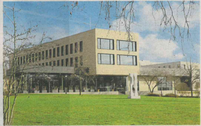
La «Climate Alliance International Conference» se déroulera au Centre Culturel CELO à Hesperange.

La commune de Hesperange, membre de l'alliance pour le climat depuis 2005 organisera la «Climate Alliance International Conference, CAIC2022» du 28 au 30 septembre 2022. Cette conférence rassemblera quelque 200 participants venant de toute l'Europe et représentant presque 2000 membres de 25 pays européens différents sous la devise : Libérer le potentiel local, favoriser la transition mondiale.